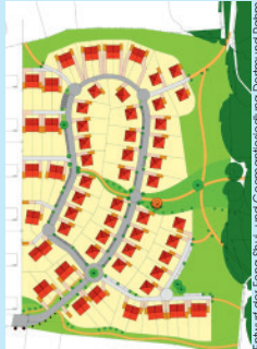
Entwurf der Feng Shui- und Geomantieseitig Dorfmund Raum

Ziel ist für die vorhandenen Ortsqualitäten die energetisch optimalen Gestaltungsempfehlungen festzustellen, um auch dem Menschen wieder eine größere Verbundenheit zu dem göttlichen All-Eins-Sein zu ermöglichen.