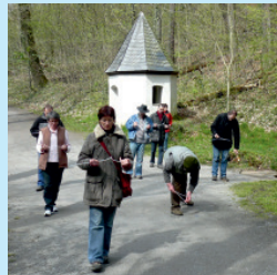
Teilnehmer beim Wunschenergiegelen

Weitere Informationen und Termine finden Sie in meiner Homepage unter „Veranstaltungen“ oder können direkt bei mir erfragt werden.